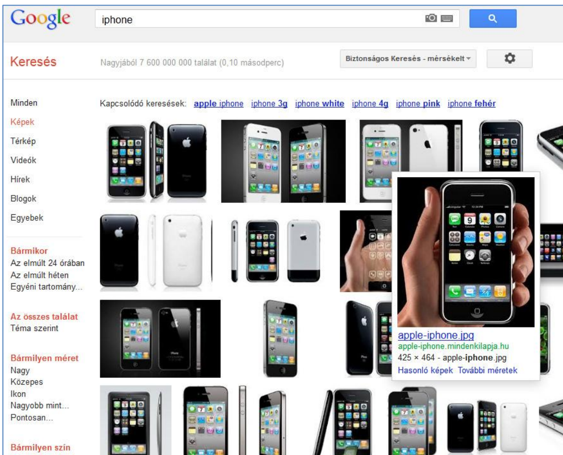
Képtalálatok az eredményoldalon

A képkeresőt ugyanazon az egyszerű módon tudjuk használni, mint az általános webes keresésnél: egyszerűen beírjuk a keresett kulcsszót/kulcsszavakat a keresőmezőbe és megnyomjuk az Enter billentyűt, vagy a Keresés gombra kattintunk. A különbség csupán annyi, hogy ebben az esetben az eredményoldalon (találati oldalon) képeket látunk.